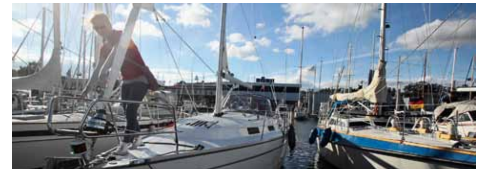
Vi lagde til ved Böbs værft i Travemünde, som blev endestation for vores tur. Havnefogden holdt et vågent øje med båden, inden den blev overtaget af den næste besætning, der atter vendte skuden mod Danmark.

Efter at have vandret byen igennem pakkede vi vores ting sammen. Det havde været nyt for os at sejle både i Smålandshavet, igennem Guldborgsund og områderne ved Femern og langs kysten forbi Grömitz til Travemünde. Forskelle og ligheder mellem danske og tyske sejlere og havne var egentlig ikke så store, som man på forhånd kunne tro. Faktisk er der i begge lande en glæde ved at være på havet og i havnene. Som dansker i Tyskland bemærkede man, at der var flere turister ude at se på både og havne, end vi er vant til. Der var også generelt flere aktiviteter og tilbud for sejlerfamilierne, når de kom i havn – fra kurbade og forlystelsesparker til sejler-, surf- og katamaranskoler. Er man mere til hygge og ro, vil man muligvis finde nogle af de tyske havne velpolerede. Det er smag og behag. Tilbage står, at området er fantastisk at sejle og være i, og at vi følte os velkomne i alle de havne, vi anløb. Der vil i området være noget for enhver smag, hvor man helt sikkert kan finde sine favorithavne, -øer og -sejlture. ■