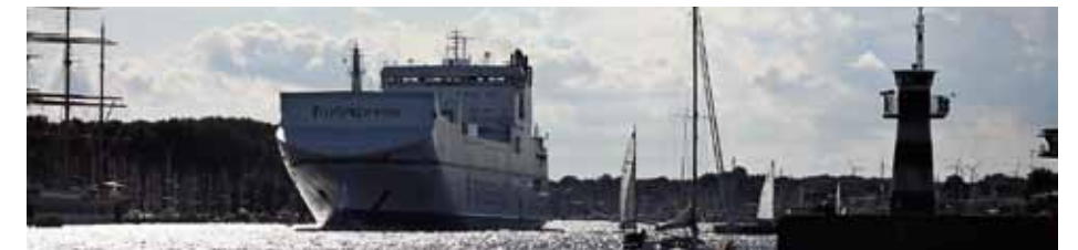
Hektisk trafik ved Travemünde. Det betaler sig ikke at tage kampen om pladsen op.

glæde ved at være på vandet. Turen var som nævnt på godt 10 sømil, og man må igen sande, at de kortere ture på under 20 sømil nu engang er børnenes favoritter.