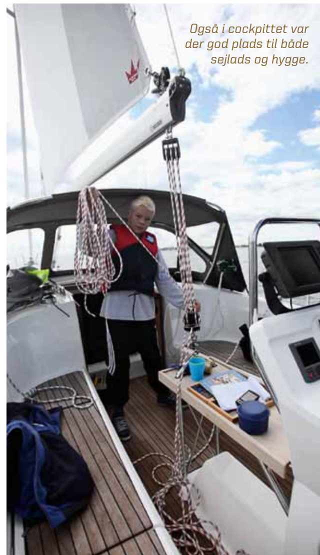
Også i cockpittet var der god plads til både sejlsads og hygge.