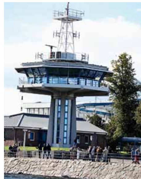
Havnen er så stor, og trafikken til og fra Travemünde og Lübeck, der ligger længere inde af Trave-folden, så tæt at det er nødvendigt med et kontrolltårn ved indsejlingen.