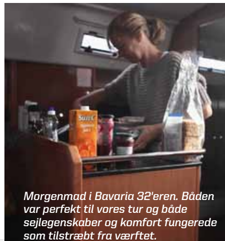
Morgenmad i Bavaria 32'eren. Båden var perfekt til vores tur og både sejlegenskaber og komfort fungerede som tilstræbt fra værftet.

Vi drog videre næste dag mod turens mål Travemünde. Vi havde endnu en forrygende sejlsad over bugten fra Neustadt. Der var bemærkelsesværdig mange sejlere, surfere, joller, motorbåde og fiskere på vandet, der så ud til at have en ægte