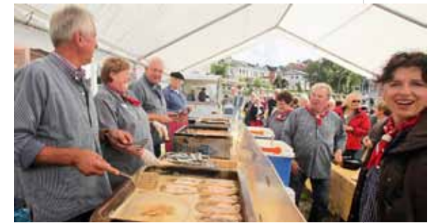
Den første lørdag i måneden er der gratis fiskebord på havnen.