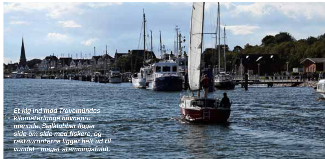
Et kig ind mod Travemündes kilometerlange havnepromenade. Sejlkubber ligger side om side med fiskere, og restauranterne ligger helt ud til vandet – meget stemningsfuldt.